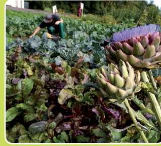
Veranstaltungen und Kurse der GartenWerkStadt