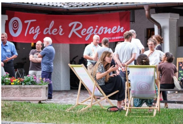
Bildunterschrift: Tag der Regionen Netzwerk auf dem 11. Bundestreffen der Regionalbewegung in Farchant: © Anton Brey, Bundesverband der Regionalbewegung e.V.